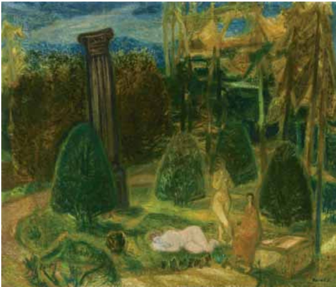
Aranykor II. – 1930-as évek második fele – olaj, vászon – 90x110 cm