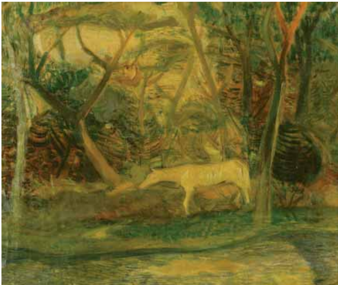
Sárga ló (Erdőbelső lóval) 1940-es évek – olaj, vászon – 59,5x70 cm