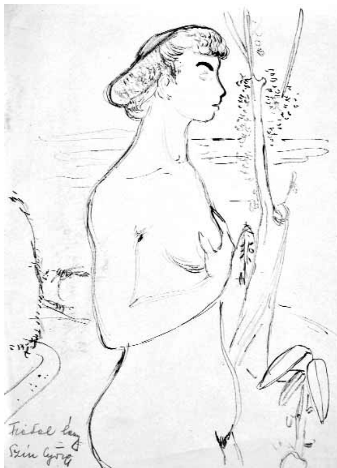
Fiatal lány – 1930-as évek második fele – papír, tus – 300x230 mm

1906-ban született Léván, Schwarz Györgyként. 1925–1927 között Párizsban élt. 1929–1933 között Benkhard Ágost tanítványaként végzte el a Képzőművészeti Főiskolát. A miskolci művésztelepen dolgozott. 1934-ben elnyerte a Szinyei Merse Pál Társaság által rendezett Tavaszi Szalonon „A falu vakja” című olajfestményével a Nemes Marcell-féle utazási ösztöndíjat. 1934-ben Olaszországban járt. Ugyanebben az évben a Képiró utca 8. szám alatt bérelt „műtermet”. Szomszédja az Ámos házaspár, Vajda Lajos. 1935-ben ismét Párizsba utazik. Megkapta a Lipótvárosi Kaszinó Ruszt emlékdíját. A Múzeum körút 1. szám alá költözött. 1936-ban vett részt első ízben a Képzőművészek Új Társaságának kiállításán, majd pár év múlva 1940 és 1943 között már valamennyi KUT-tárlaton, valamint az Országos Magyar Izraelita Kulturális Egyesület (OMIKE) kiállításain is szerepelt műveivel.