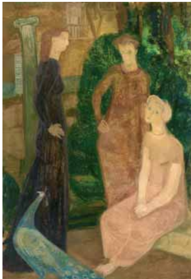
Nővérek – 1938 előtt – olaj, vászon – 149x104 cm