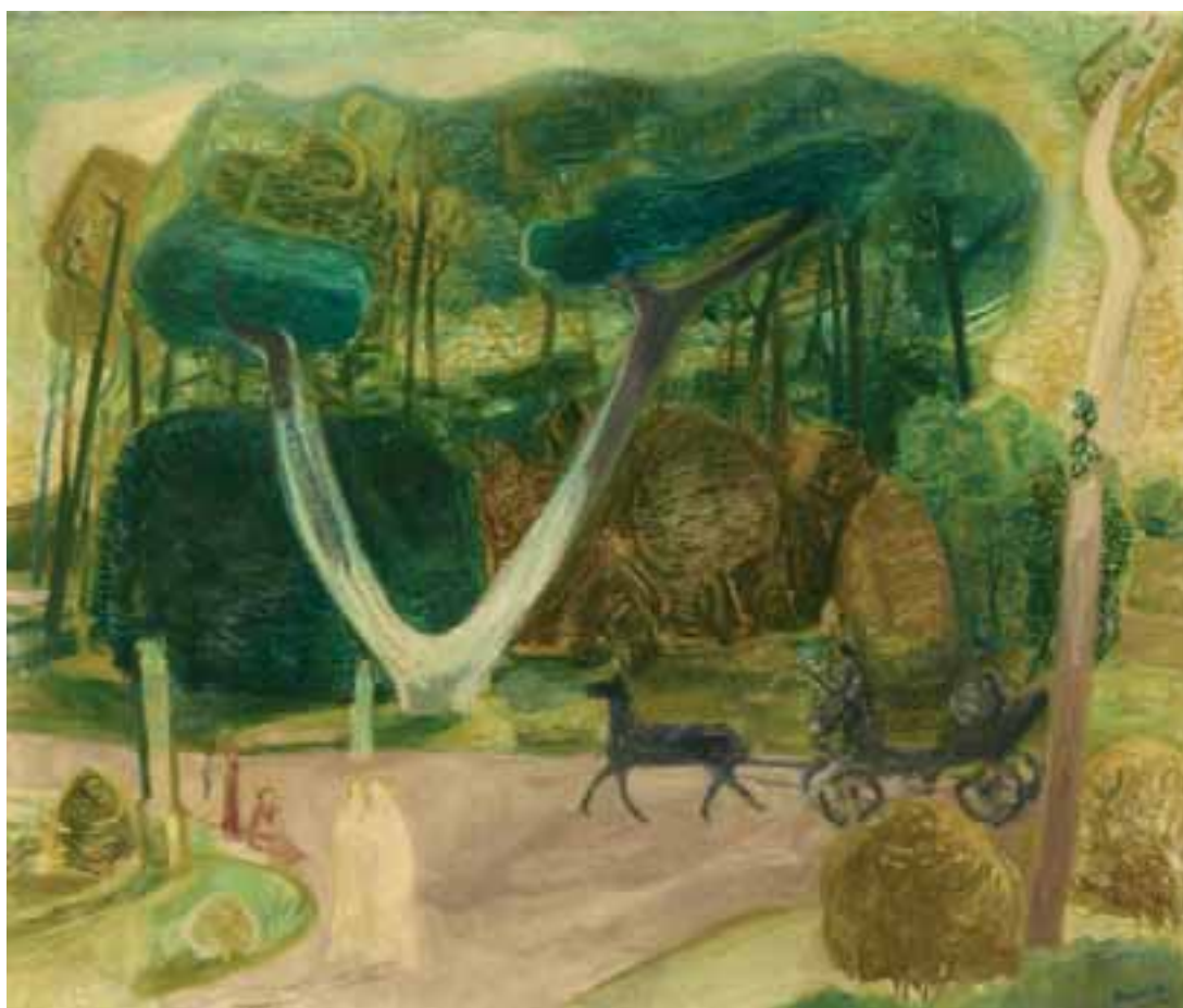
Séta a parkban (Sétakocsikázás) – 1938 előtt – olaj, vászon – 99x118 cm