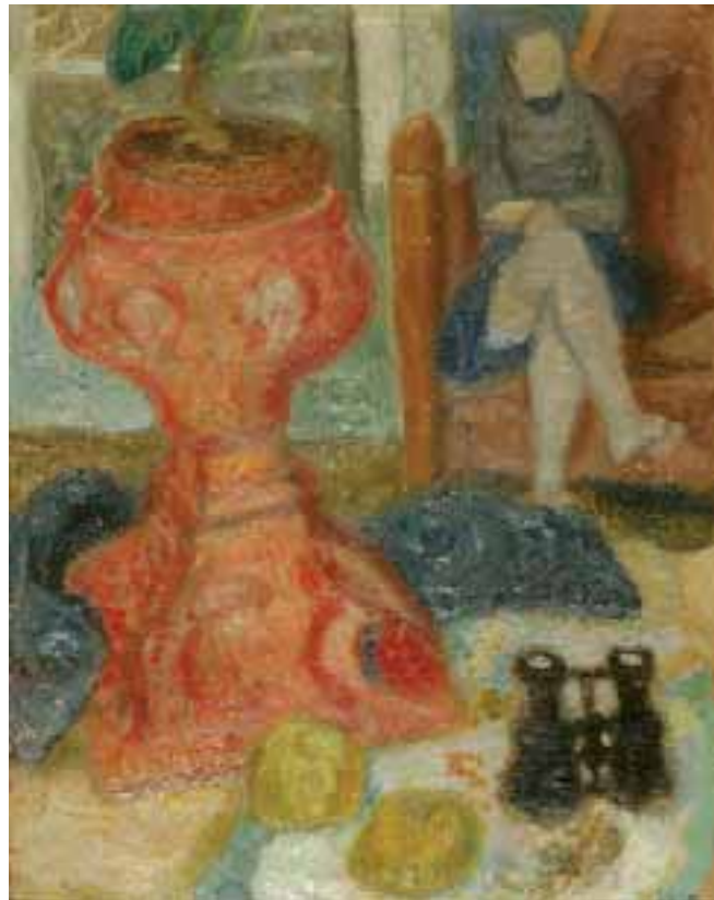
Csendélet látcsóval (Asztal vázával, távcsóval és ülő nővel) –1938 előtt – olaj, vászon, 51x41 cm