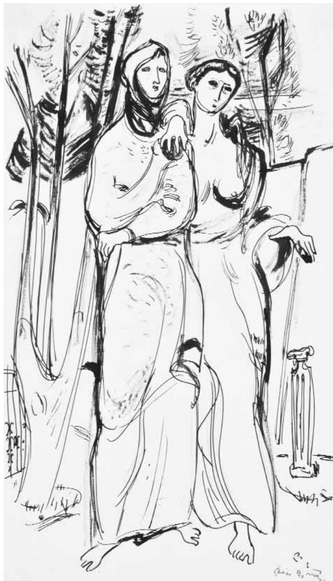
Bánat (Vázlat az Aranykor című festményhez) – 1938 előtt – papír, tus – 390x230 mm