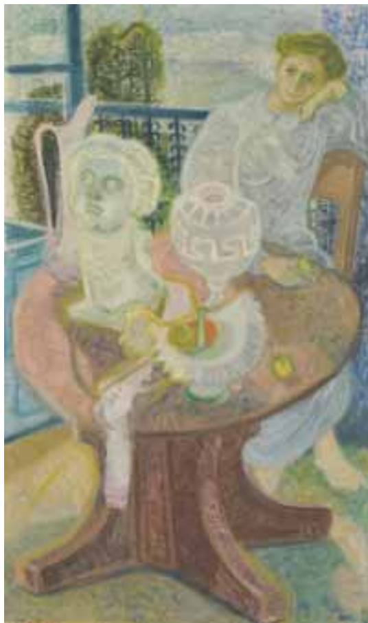
Emlékezés – 1938 előtt – olaj, tempera – 130x75 cm