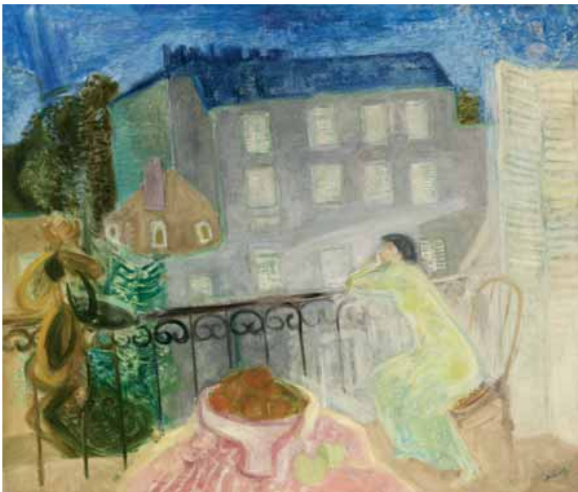
Párizsi erkély (Teraszon) – 1935 – olaj, vászon – 100x120 cm