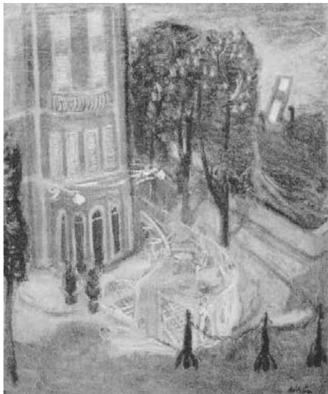
Dunaparti ház terrasszal – 1940-es évek olaj, vászon – 71x85 cm