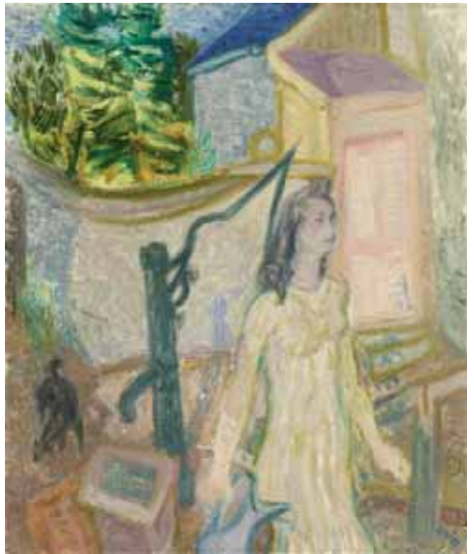
Kútnál – Szentendre – 1930-as évek vége – olaj, vászon – 70x59 cm