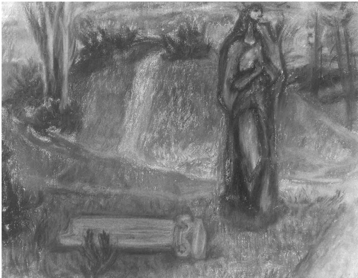
Parkrészlet szoborral (Elfátyyolozott nő törött oszloppal) – 1930-as évek második fele – pasztell, papír – 45x61 cm