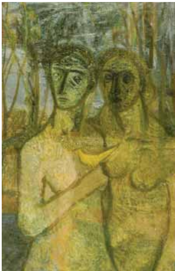
Aktok madárral (Két nő kanáriival) – 1940-es évek – olaj, vászon – 94,5x62 cm