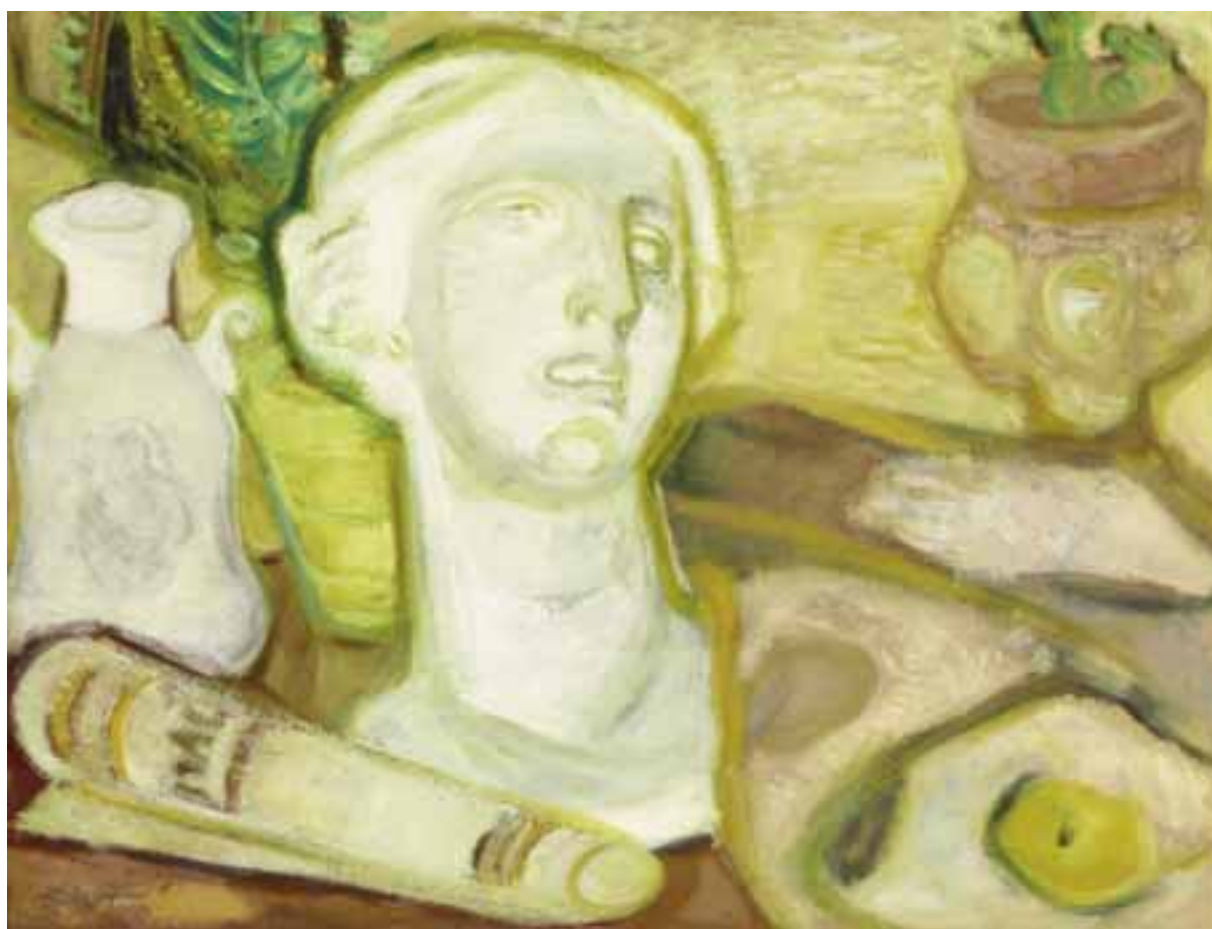
Műtermi csendélet I. – 1938 előtt – olaj, vászon – 48x66 cm