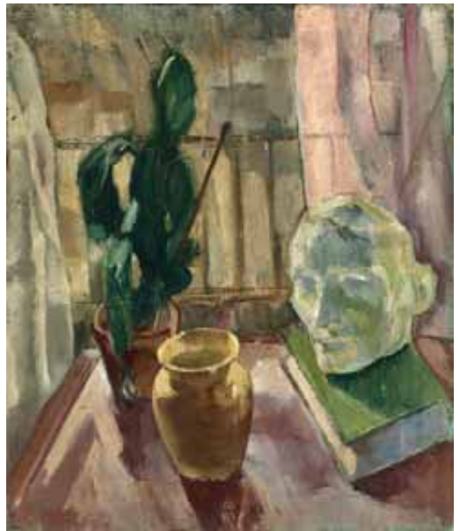
Kilátás a műteremből – 1934 körül – olaj, vászon, 69x56 cm