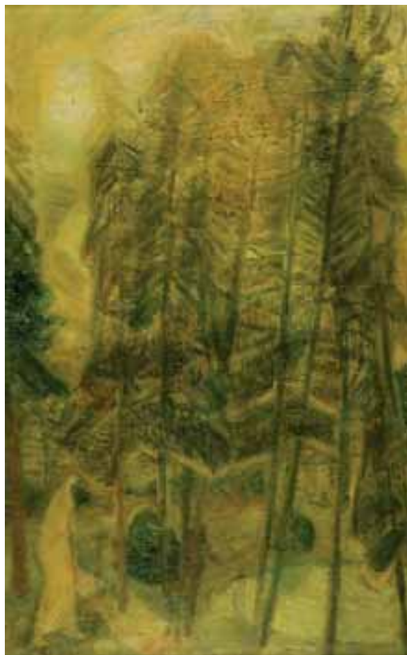
Fenyők (Fák között sétáló alak) – 1940-es évek – olaj, vászon – 99x61,5 cm