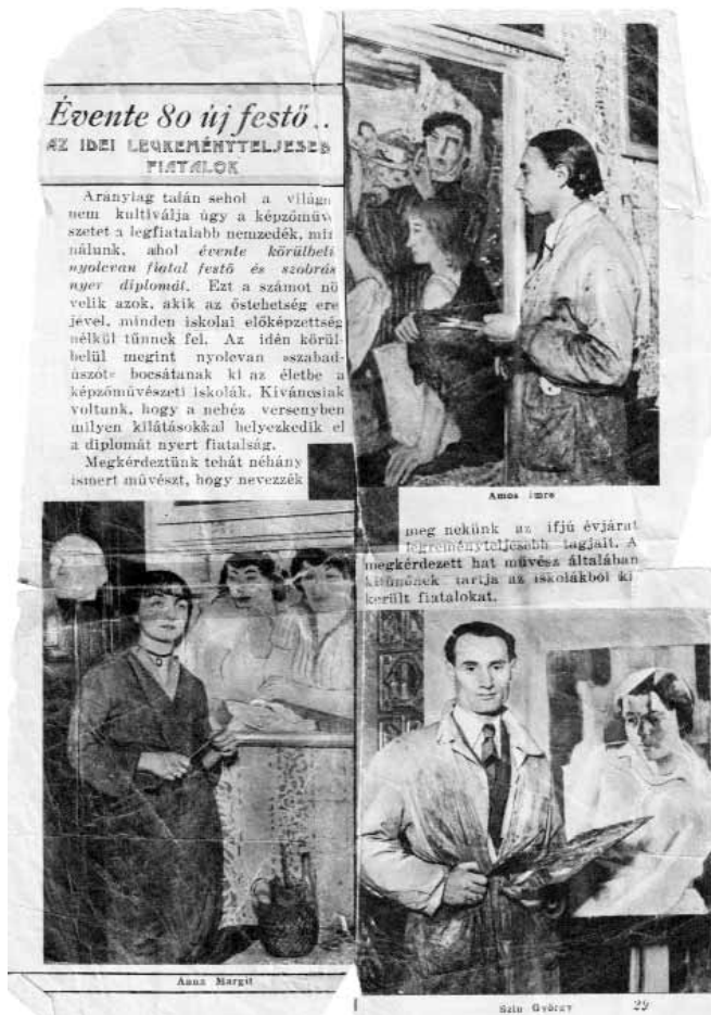
Újságvágat a Színházi Élet 1934-es, pünkösdi számából