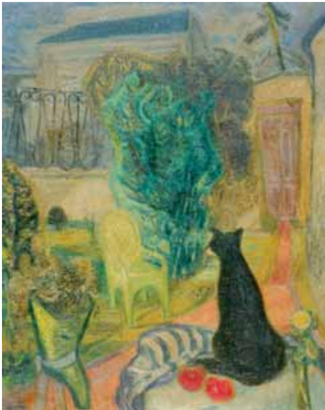
Macska a kertben (Fekete macska) – 1935 körül – olaj, vászon, 99,5x79 cm