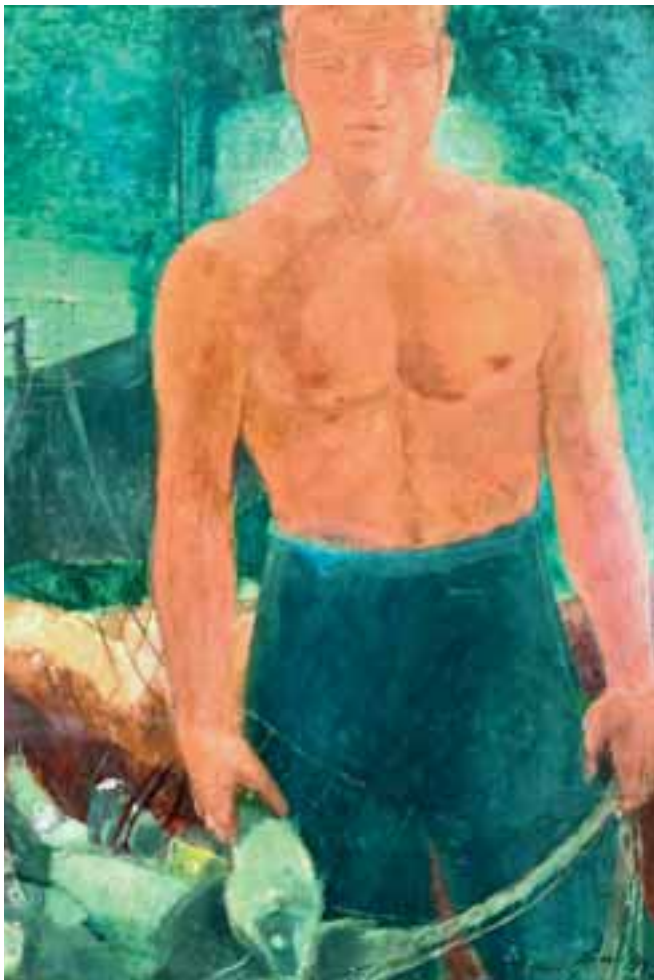
Halász – 1934 – olaj, karton – 125x88 cm