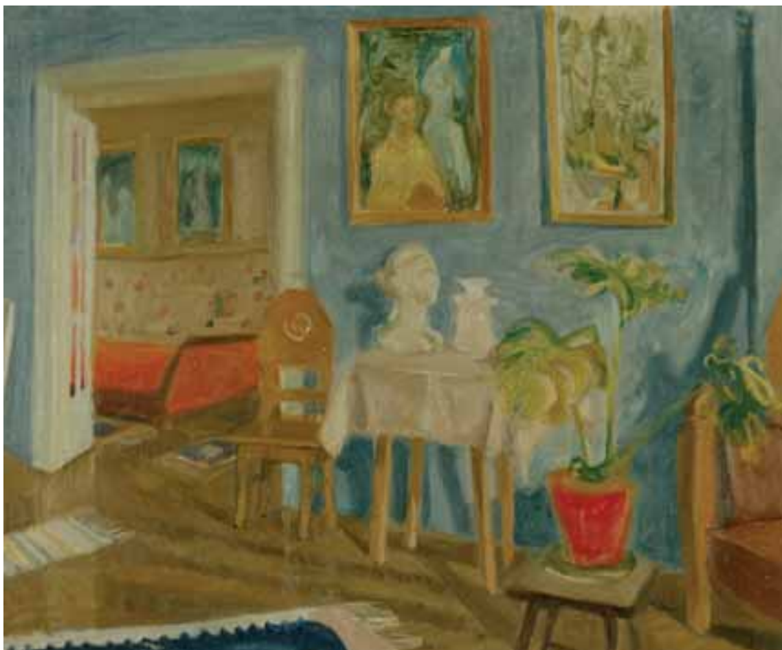
Enteriőr (Szobabelső asztallal, festményekkel, növényvel) – 1940-es évek – olaj, vászon – 51x61 cm