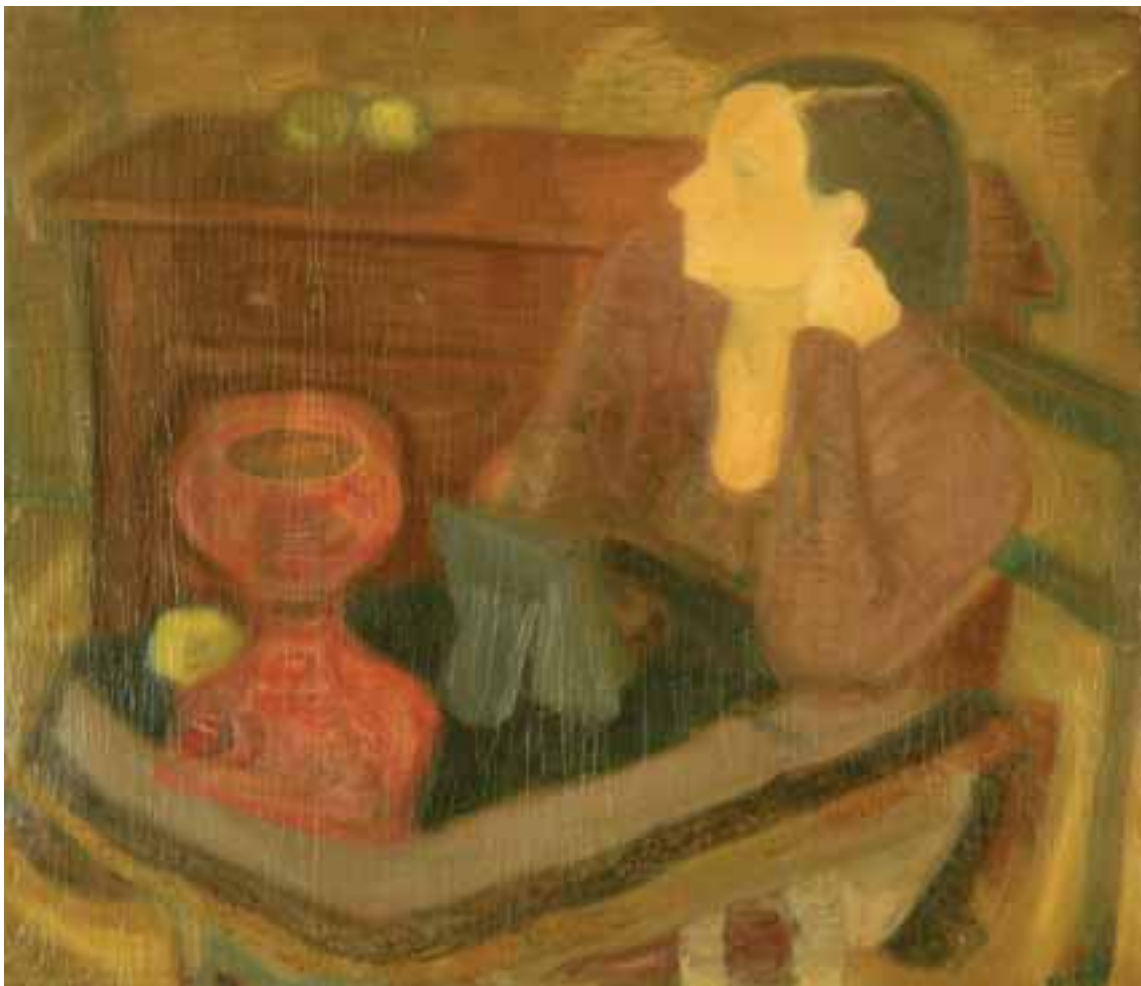
Könyöklő nő (Feleségem) – 1935 körül – olaj, vászon – 78,5 x 90 cm