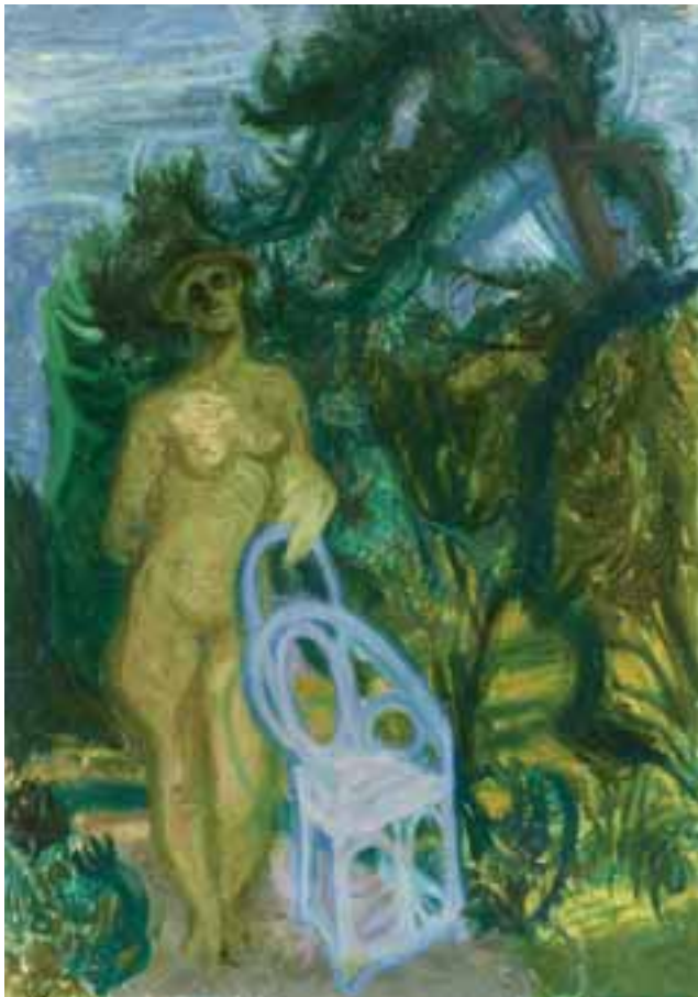
Modell kék karosszékkal – 1930-as évek második fele – olaj, vászon – 99x70 cm