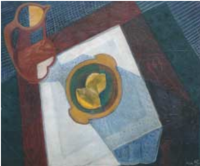
Csendélet korsóval és citromokkal – 1930 – olaj, vászon – 50x60 cm