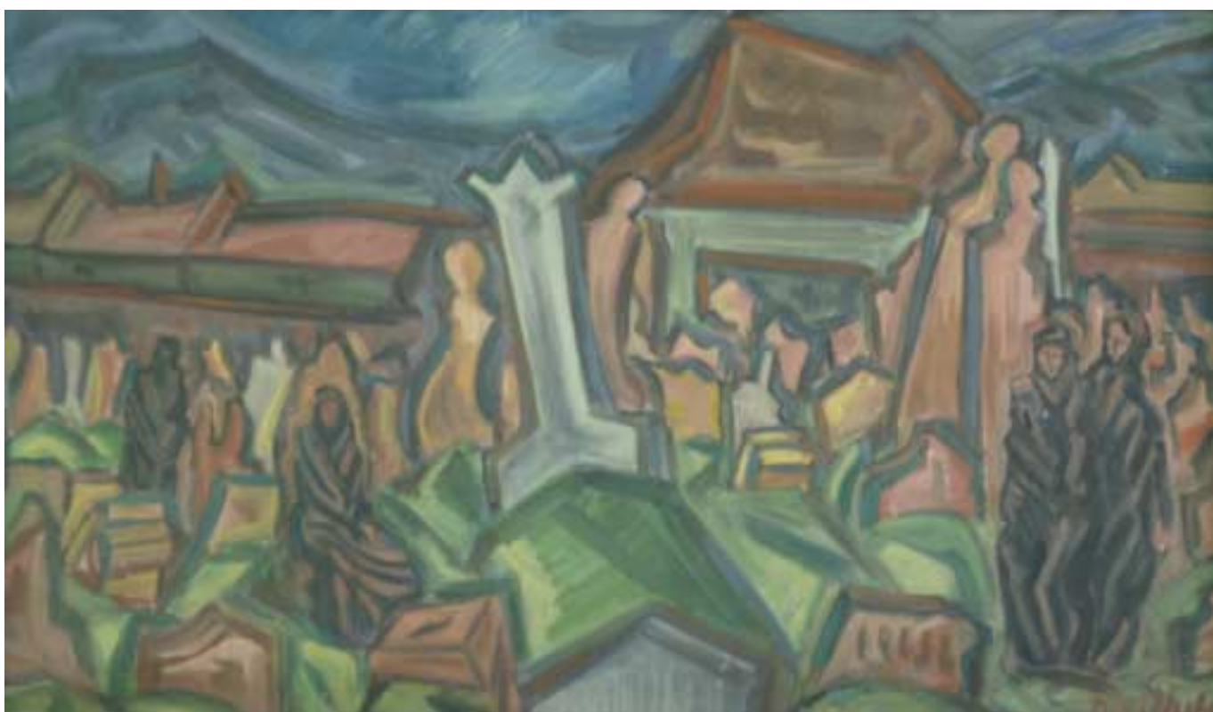
Régi temető – 1937–1938 – olaj, tempera, karton – 49x84 cm