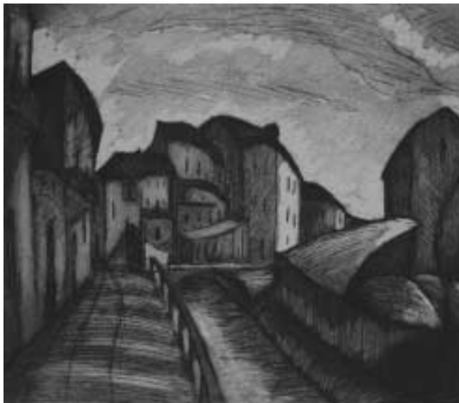
Naviglio – 1927 – rézkarc, papír – 135x158 mm

iskola tárlatán 1924-ben volt. Még ebben az évben megélhetési okból és egyben művészetismeret szerzés céljából Sugár Andorral Olaszországba ment. Ez a döntés ellentétben állt más fiatalokéval, akik inkább Párizst választották. Mindez jó időre meghatározta művészetének alakulását.