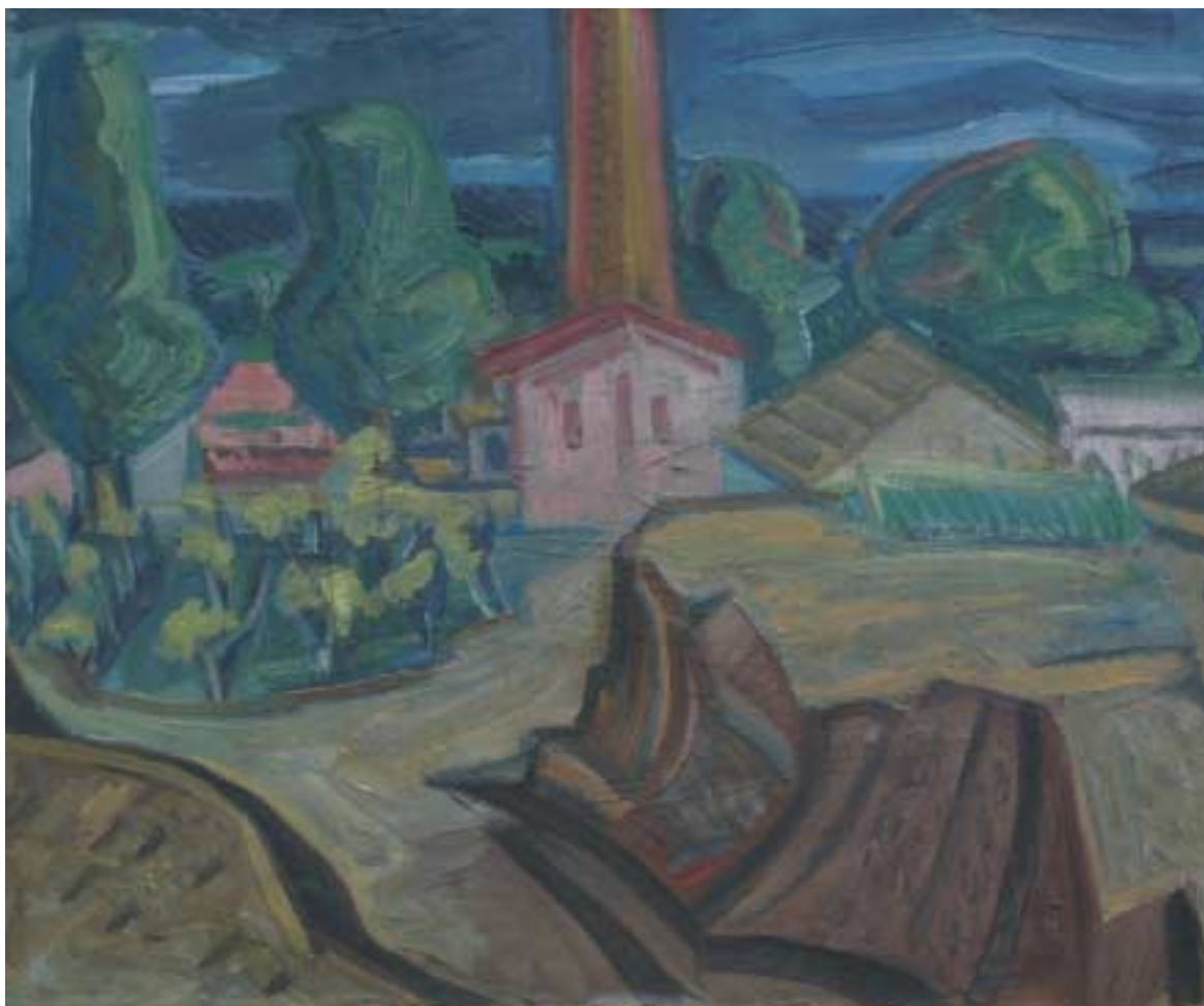
Budakeszi gépház (Budakeszi vörös kémény-vázlat) – 1937 – olaj, vászon – 49x60 cm