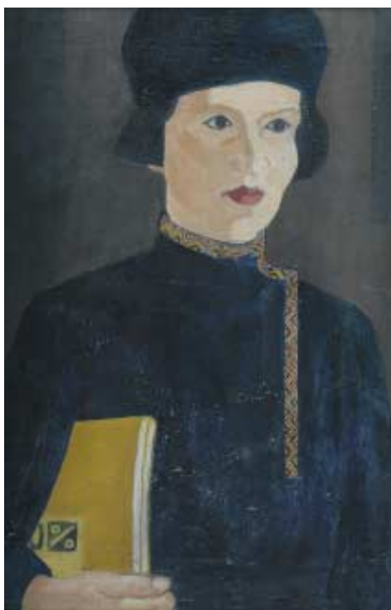
Oroszblúzos diáklány – 1929 – olaj, vászon – 56x37 cm