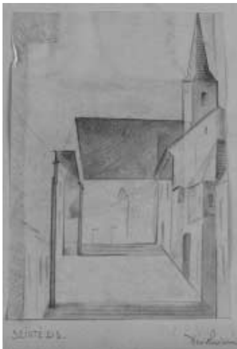
A dési templom III., Szintézis 1931 – 1931 – ceruza, papír – 177x123 mm