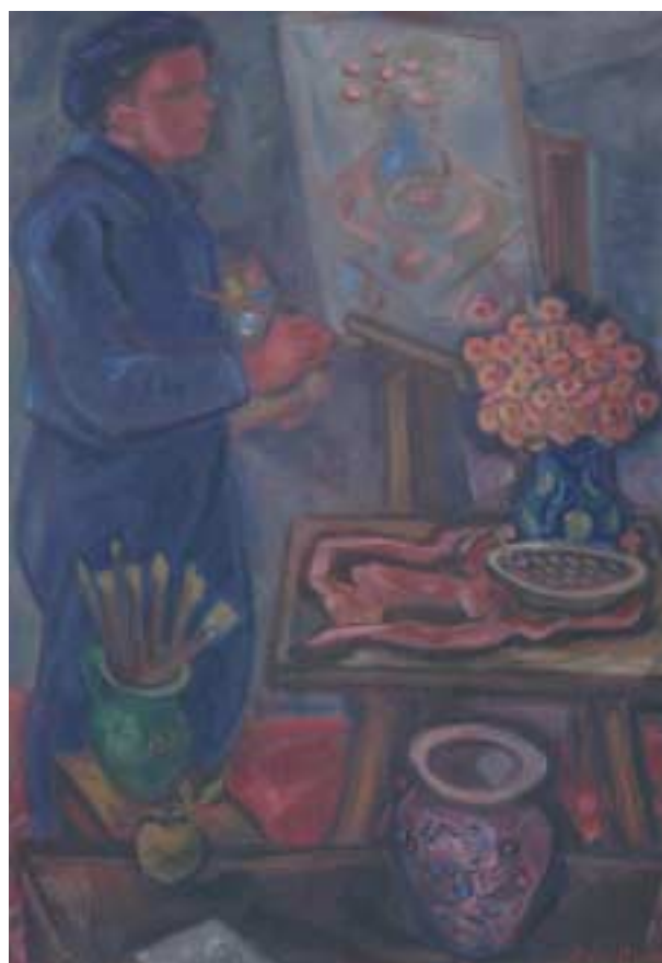
Önarckép műteremben – 1938 körül – olaj, vászon – 100x71 cm