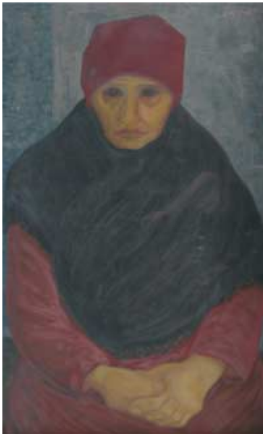
Teréz arcképe – 1933 – tempera, papírlemez – 87x52 cm