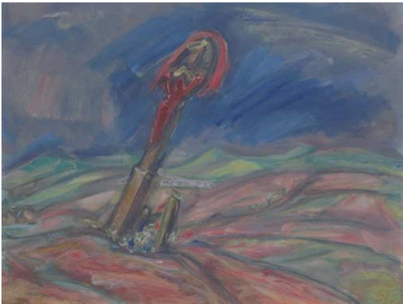
Hollókői vörös feszület – 1939 – olaj, tempera, papírlemez – 30x38 cm