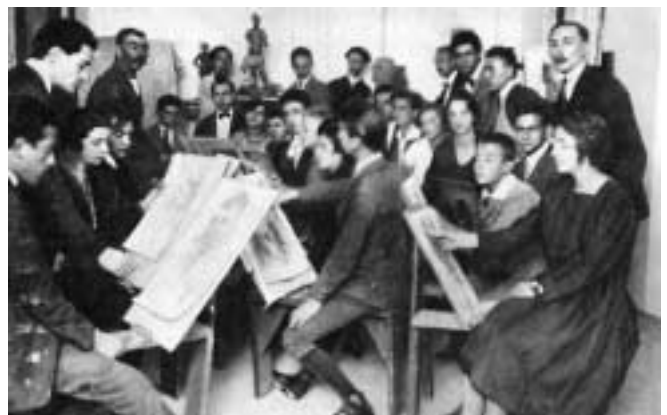
A Podolini-szabadiskola növendékei 1922 körül