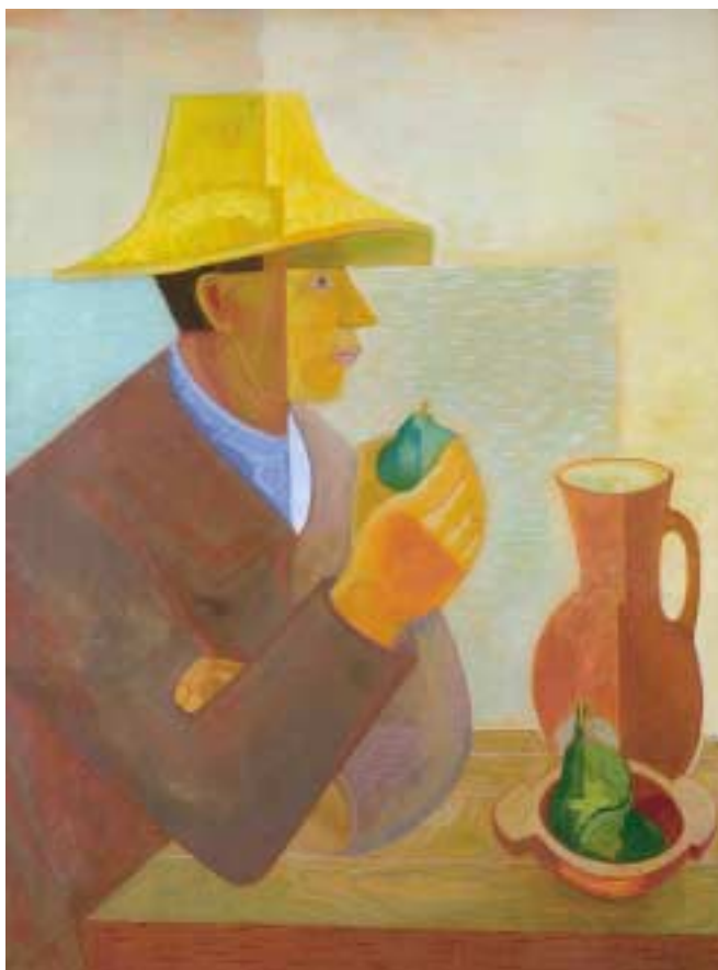
Kalapos férfi fügével (Szalmakalapos paraszt körtével) – 1931 – tempera, papír – 87x66 cm