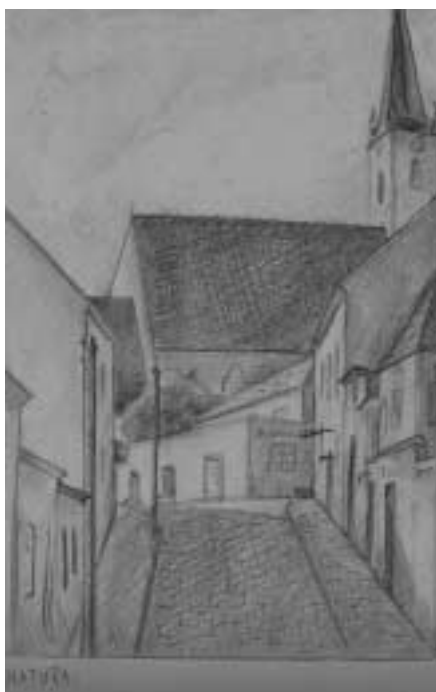
A dési templom I., Natura 1931 – 1931 – ceruza, papír – 175x125 mm