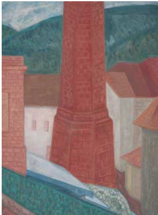
Budakeszi vörös kémény – 1937–1938 – olaj, papírlemez – 78x58 cm