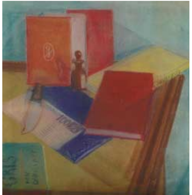
Csendélet 100%-kal – 1930 körül – pasztell, papírlemez – 370x350 mm