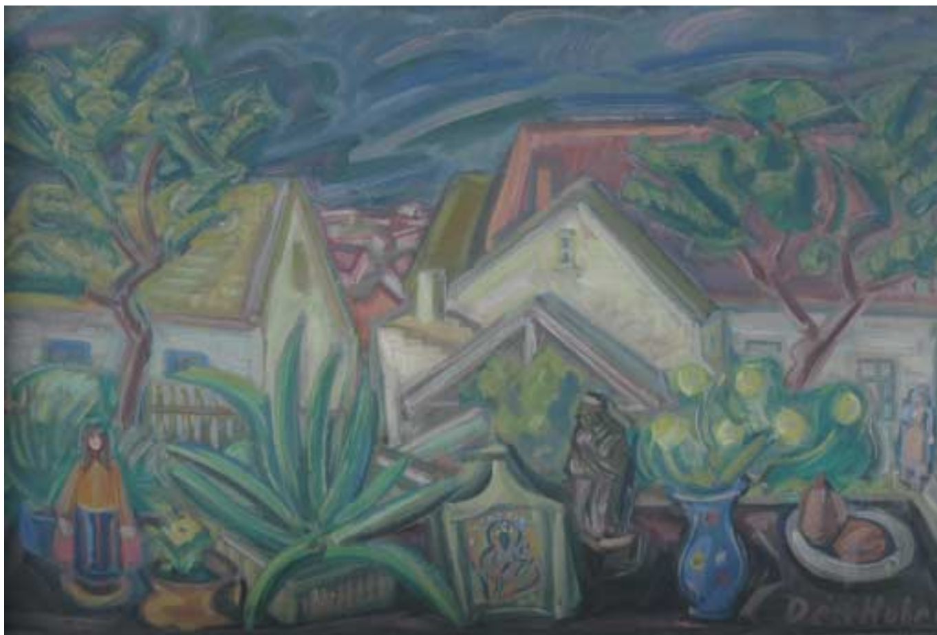
Csendélet tájjal (Kilátás a rákoscsabai házakra) – 1938 – olaj, karton – 66x100 cm