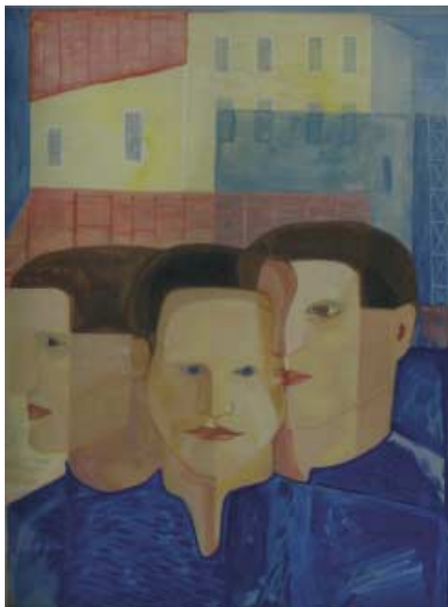
Tömeg (tanulmány) – 1932 – tempera, papír – 63x95 cm