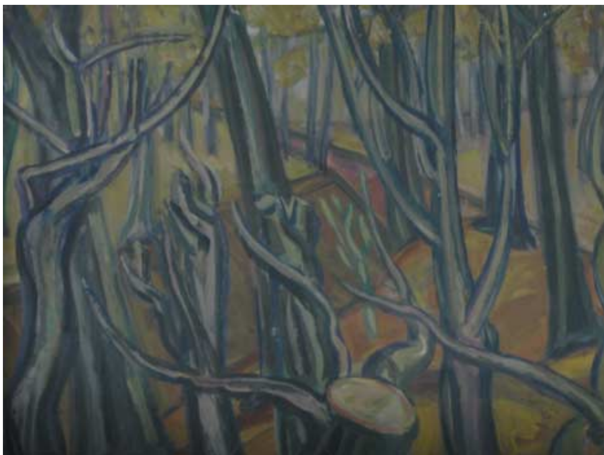
Őszi budakeszi erdő (Kopasz fák) – 1937–1938 – olaj, papírlemez – 48x62,5 cm