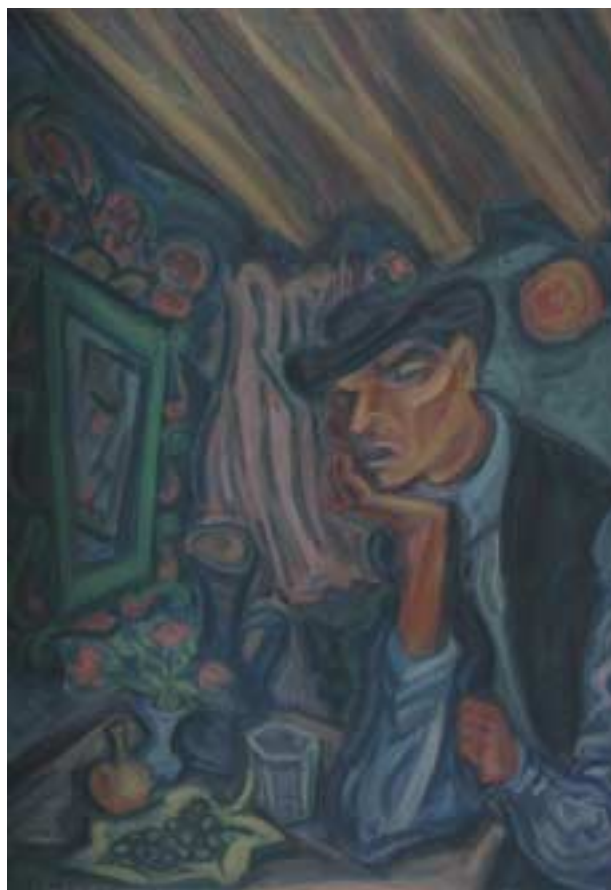
Keserves – 1938 – olaj, vászon – 100x70 cm