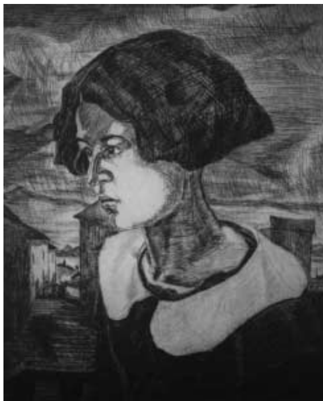
Stefike – 1926 – rézkarc, papír – 268x223 mm

Művészi fejlődésének új szakasza kezdődik 1928-tól. Ha figyelembe vesszük, hogy ebben az évben még az olaszországi stílusára emlékeztető művek készültek, meglepő a IV. Rend c. sorozat, amely a proletárok útját mutatja be a lázadástól a győzelemig nyolc lapon. Az elemzések többsége Frans Masereel belga művész képregényeit hozza fel mintának, és van hivatkozás Bortnyik Sándornak a tízes évek végén készült konstruktív-expresszionista munkáira, ami reális alapokon nyugvó összevetés. Azt is tudjuk ugyanakkor, hogy Dési Huber még Olaszországban látta Giandante X. piktogram-szerű fekete-fehér műveit, és bár találkozásukkor magát a művész-költőt 1926-ban még posztexpresszionis-