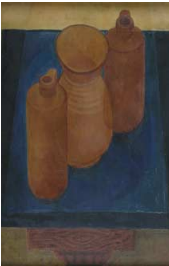
Csendélet korsókkal – 1929 – olaj, vászon – 60x40 cm