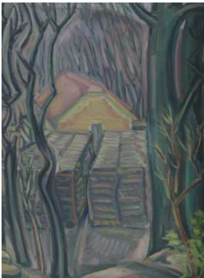
Budakeszi farakások – 1937–1938 – olaj, vászon – 80,5 x 61 cm