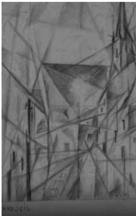
A dési templom II., Analízis , 1931 – 1931 – ceruza, papír – 178x123 mm