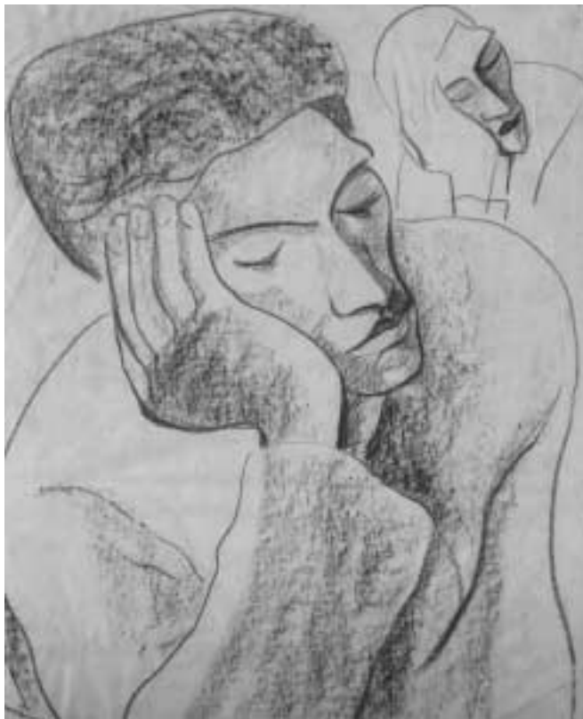
Fejtanulmány (Könyöklő munkás tanulmány) – 1931 – szén, papír – 480x400 mm

járhat, ami az alkotóerő fokozódásában mutatkozik meg. 1933-ban, 1935-ben, 1937-ben tölt hosszabb időt szanatóriumban. A drága szanatóriumi kezeléseket fedezetét alapítványi támogatások biztosították. Betegségével függ össze, hogy bár részt vett azokban az előkészületekben, amelyek a szocialista képzőművészcsoporthoz létrejöttét célozták meg, mégsem lett aktív tag, csupán szimpatizáns. Elvi vitái is voltak a csoportban, így az aktív jelenlét helyett a kiállításokon való szereplésekkel vett részt a csoport művészeti életében. A kezelése alatt írta számos elméleti tanulmányát, valamint leveleit, amelyek arra utaltak, hogy a kényszerű alkotói szünetek alatt „fejben festett”. Mindez magyarázatot adhat arra a jelenségre, amely 1935 körül egy kötöttebb, kubisztikus művészetből az expresszionizmus jellegzetességeit tartalmazó festészetbe való váltást mutatott. A 30-as évek első felének személytelen, sematizált kompozícióival szemben művészete individuális lesz. Ez egybeesett a magyar művészetben elsősorban Szentendrén kibontakozó újfajta természetlátással, „újexpresszív” kifejezésmóddal. Dési szoros kapcsolatban állt ekkor a szentendrei festők egy részével, többek között Modok Máriával, Barcsay Jenővel. Ráadásul felszabadító erővel hatott rá a budakeszi szanatórium környéki táj változékony színvilága, a természet gazdag burjánzása.