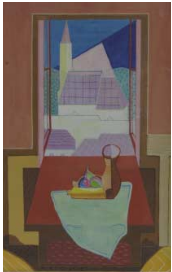
Nyitott ablak a dési templommal – 1930 – tempera, papír – 94x59 cm