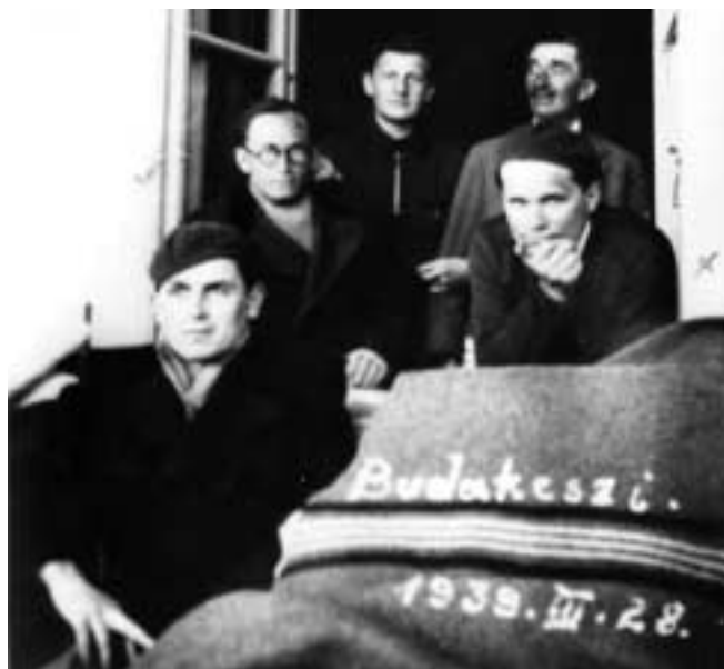
A budakeszi tudószanatóriumban 1939-ben

Dési számára a kubista csendélet volt az a műfaj, amelyben az új szocialista művészet nyelvét ki lehetett dolgozni. A csendéleteken ábrázolt jól ismert tárgyak – a hangszerek, poharak üvegek – mellett megjelentek az akkori baloldali kultúra kellékei, szimbólumai (pl. Csendélet 100%-kal , (1930 k.), Sarló-kalapácsos csendélet (1932 k.), Csendélet Liebknecht-emléklappal (1930 k.). Ez utóbbi érdekessége, hogy a címadó grafikánál erősebb hangsúlyt kap a kompozíción látható „Kleopátra-fej” – ami Dési Hubernek az egyiptomi művészet iránti érdeklődésére utal, – mint Käthe Kollwitz alkotása. Hasonlóan, a Sarló-kalapácsos csendélet en, a sarló a kompozícióban „eltűnik”, mintha tárgyi jellegétől megszabadulva a kubizmus geometrikus formavilágának létjogosultságát igazolná.