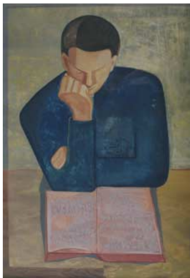
Olvásó munkás – 1932 – tempera, papírlemez – 96x62 cm